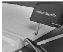
Вырезания U-образных профилей для помещения кабеля в изоляционные плиты