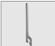
Стандартное лезвие 50 мм