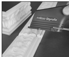
Аккуратного отрезания гипсовых планок