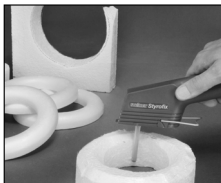
Сборки венцов из пенополистирола