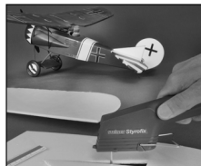
Тонких разрезов в моделестроении