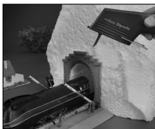
Моделирование ландшафтных моделей